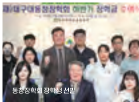
동창장학회 장학생 선발