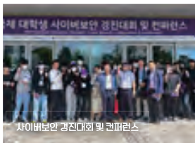
사이버보안 경진대회 및 컨퍼런스