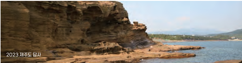
2023 제주도 답사

중등학교 정교사(2급) 지리, 중등학교 정교사(2급) 통합사회(교직융합전공 이수시), 측량 및 지형 공학 정보기사 등