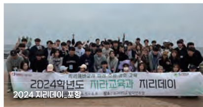
2024 지리데이. 포항