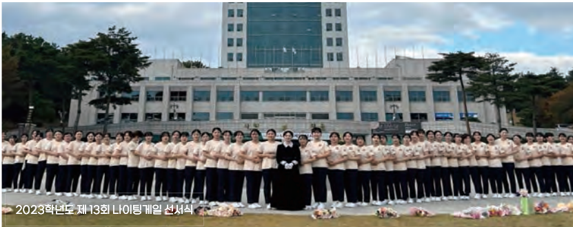
2023학년도 제13회 나이팅게일 선서식