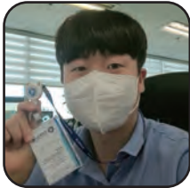
'20년 한국부동산원 입사 도오우(15학번)

우리 학과는 지적, 공법, 금융, 경제, 도시계획, 지리정보체계 등 부동산과 관련된 여러 분야의 강의를 수강할 수 있어 향후 다양한 분야로의 진로 선택이 가능합니다.